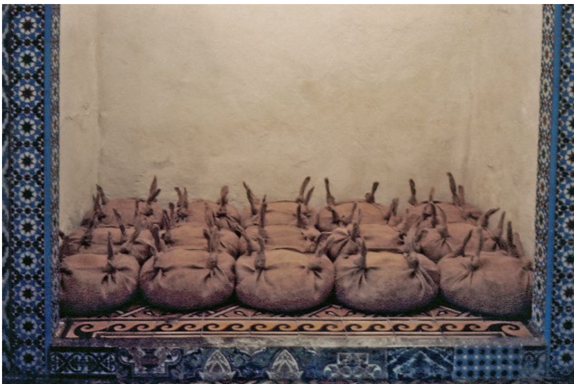
Younès Rahmoun, Hajibat , 1998, sacs de jute remplis de sciure de bois, archives de l'artiste