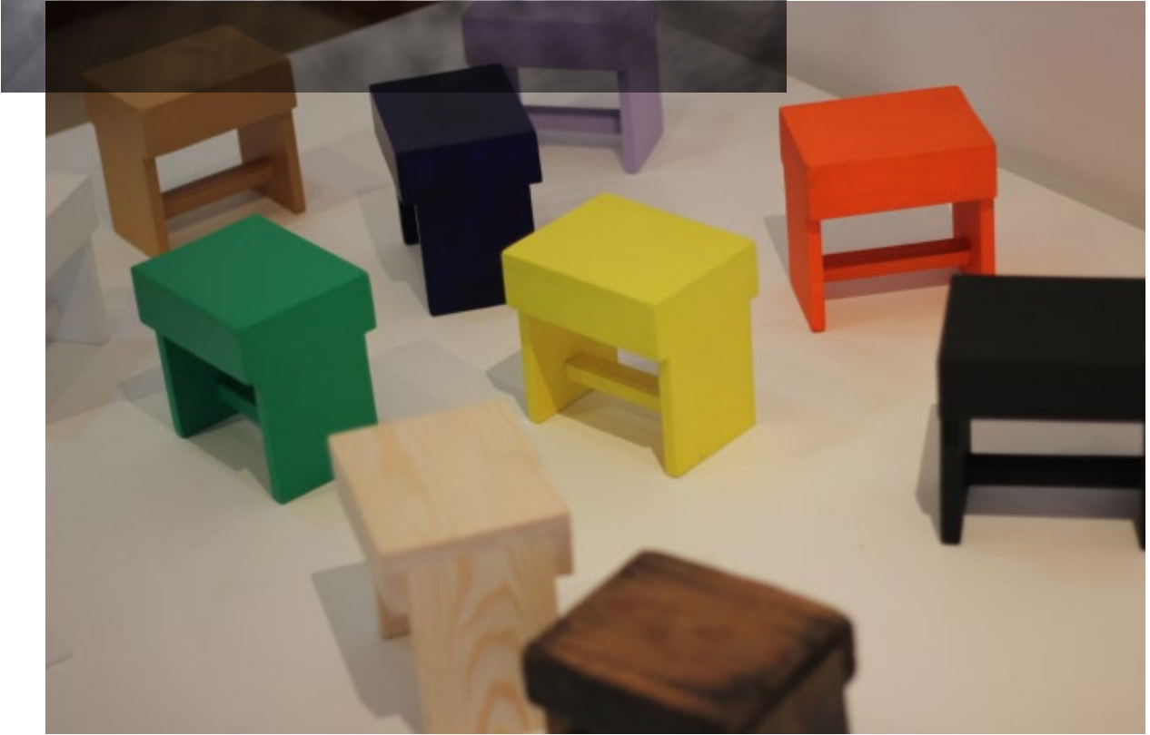
Khalid el-Bastrioui, Traveling, 2016, tabourets de cireur, dimensions variables. Courtesy de l'artiste

البسطريوي خالد نسرت، 2012 سوخر باذن من الفنان 100 x70، وخبوط