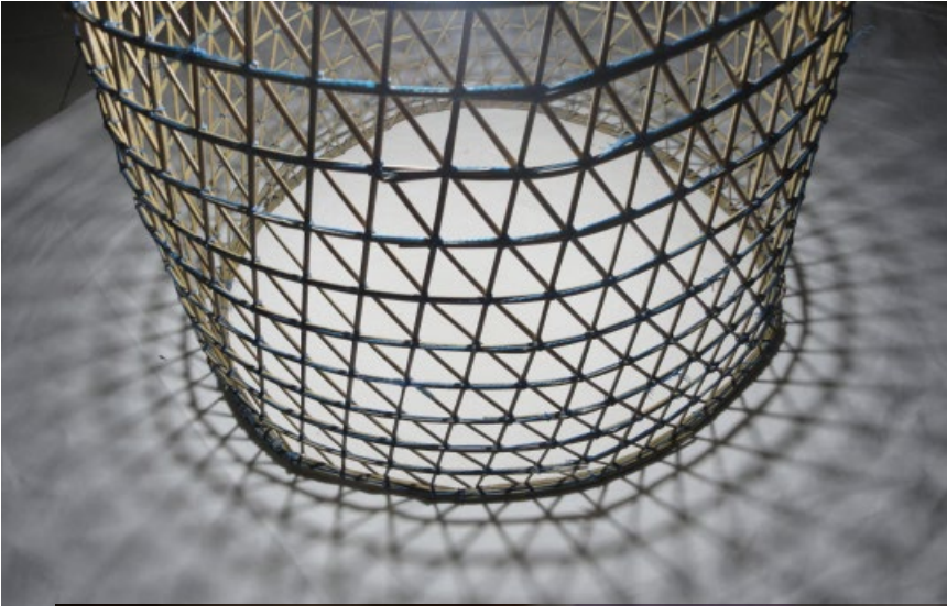
Khalid el-Bastrioui, Nassart, 2012, osier et fils, 100x70 cm.

البسطريوي خالد نسرت، 2012 سوخر باذن من الفنان 100 x70، وخبوط