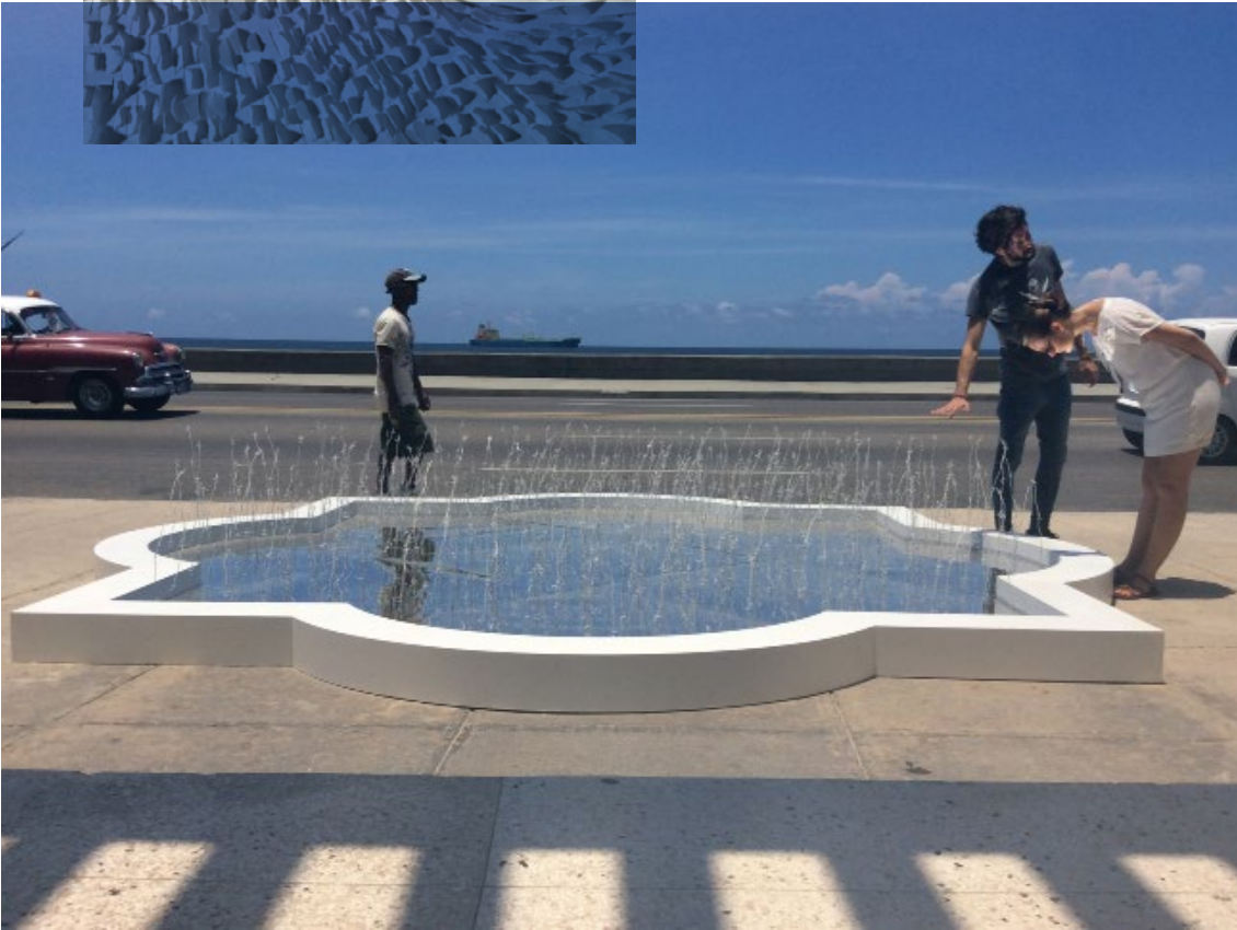
Safaa Erruas, Fuente de espinas, 2015, structure en bois, miroir et fils barbelés peints, corniche de El Malecon, la Havane, 400x400 cm. Courtesy de l'artiste

الرواس صفاء نقطة بيضاء، 2012 ورق من القطن ممزق، 53x53 سم بإذن من الفنانة و رواق 21، الدار البيضاء