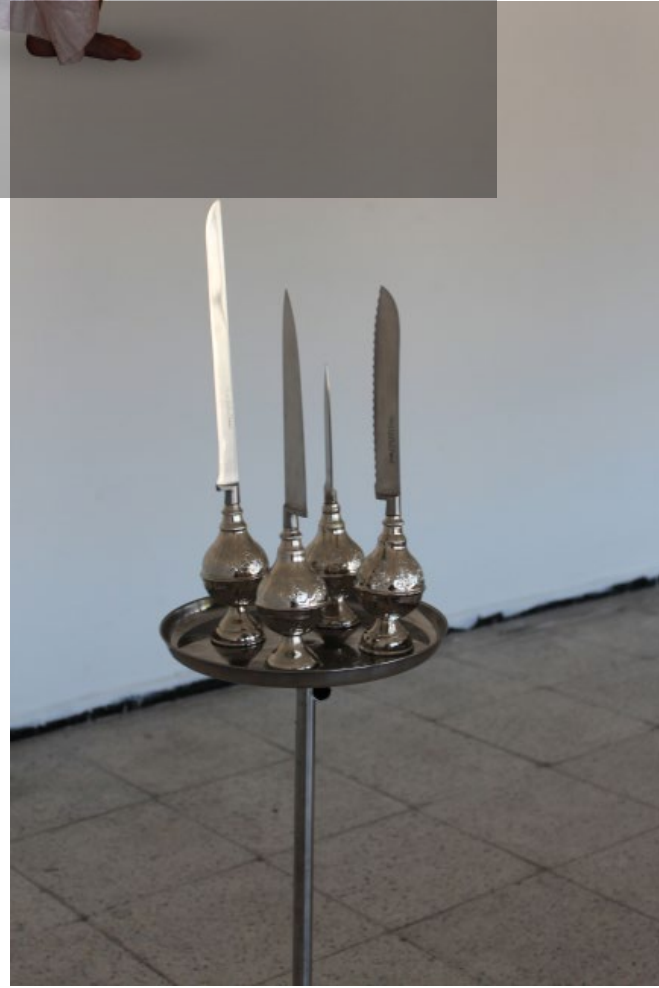
Etayeb Nadif, El-Merecha, 2013, lance-parfums, lames de couteaux et plateau sur pied, dimensions variables. Courtesy de l'artiste

نظيف الطيب شرثاٲ، 2013 سلسلة فوتوغرافية بإذن من الفنان