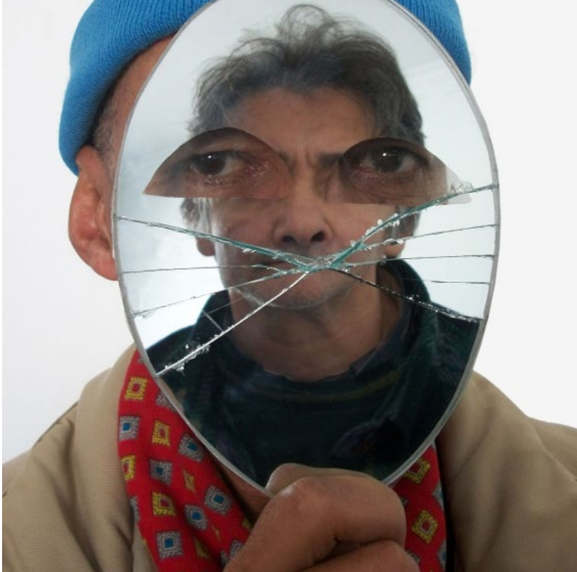
Batoul S'Himi, Portrait miroir, 2012, photographies, 200x160 cm.

السحيمي الباتول بورتريه مرآة، 2012 صور فوتوغرافية، 200x160 سم