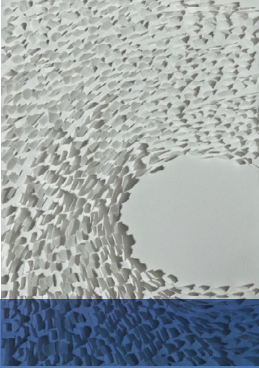
Safaa Erruas, Note Blanche, 2012, papier coton déchiré, 35x25 cm. Courtesy de l'artiste et galerie L'Atelier 21

الرواس صفاء نقطة بيضاء، 2012 ورق من القطن ممزق، 53x53 سم بإذن من الفنانة و رواق 21، الدار البيضاء