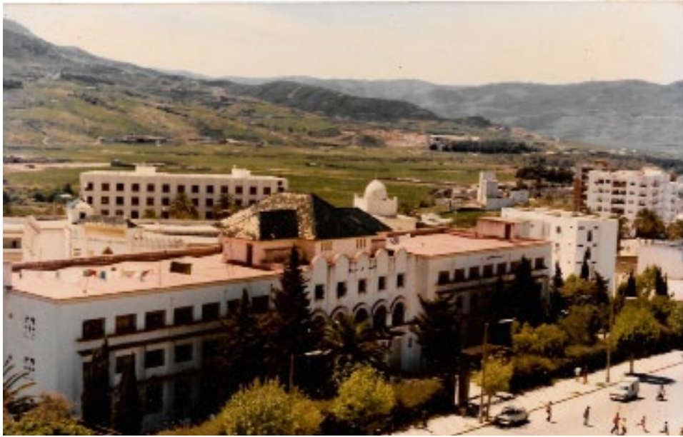
Vue de l'école des Beaux-arts de Tétouan, 1985