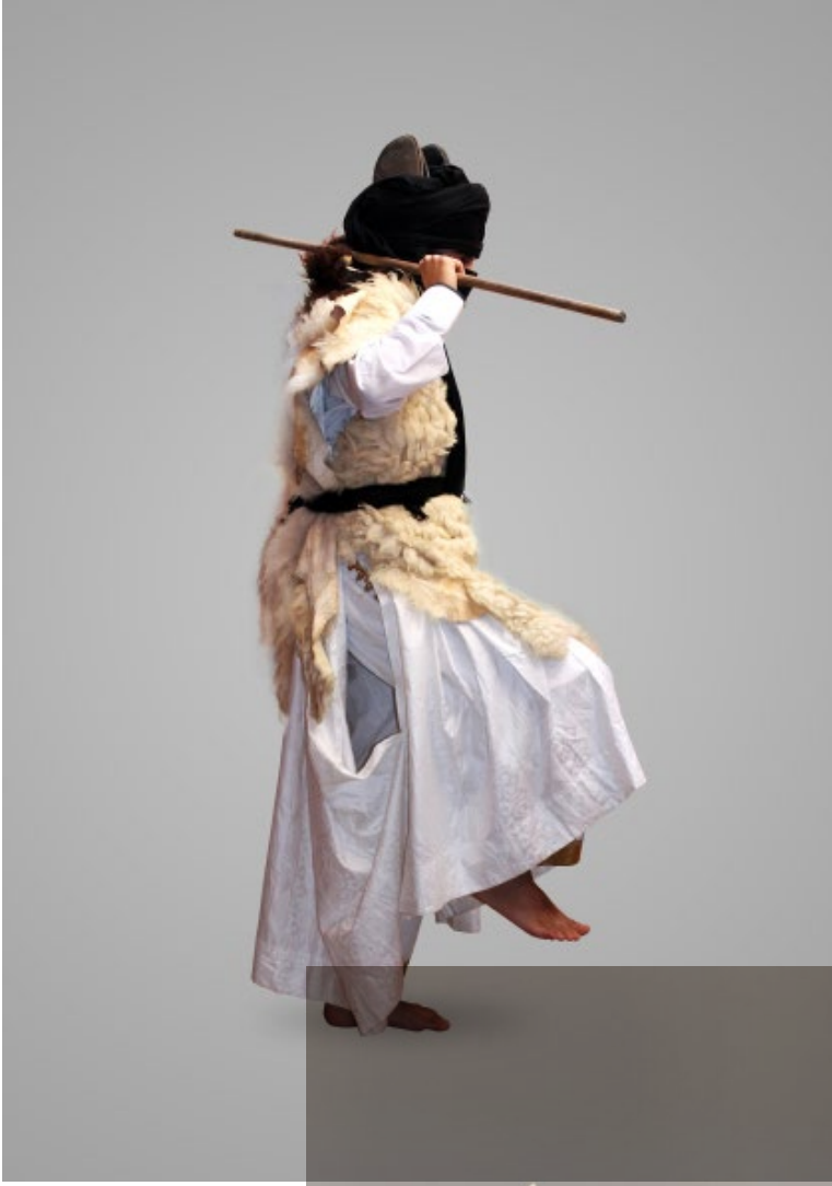
Etayeb Nadif, Chertate, 2013, série photographique.

نظيف الطيب شرثاٲ، 2013 سلسلة فوتوغرافية